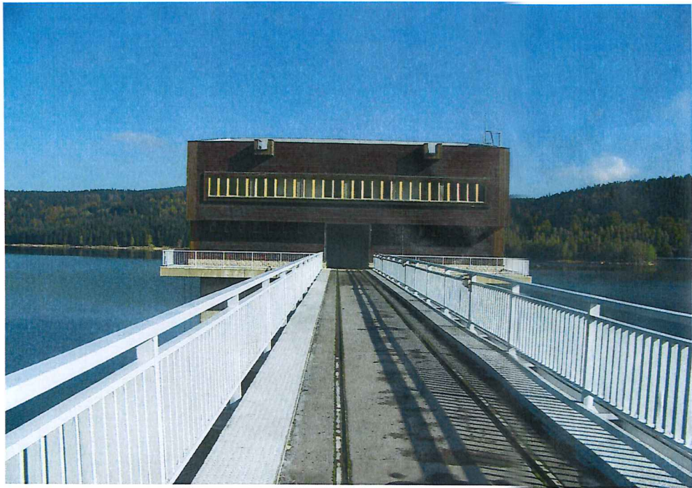
Pohled na odběrný objekt s přístupovou lávkou.